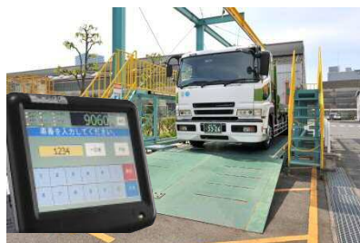
トラックスケール

産業廃棄物の収集、運搬、処分の各過程においては、その重量を計測することが義務づけられています。 クボタのハカリは、国が認定した検定品です。産業廃棄物の処理や再利用の工程に安心してご導入ください。