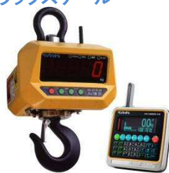
new 1.2tタイプ新登場! クレーンスケール