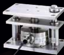
耐圧防爆・圧縮型デジタルロードセルユニット (振れ止め・浮き上がり防止機能付き)