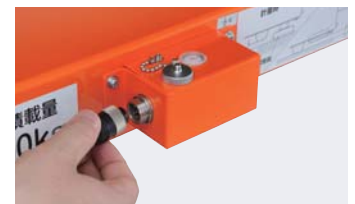
移動にベンリな脱着式防水コネクタ